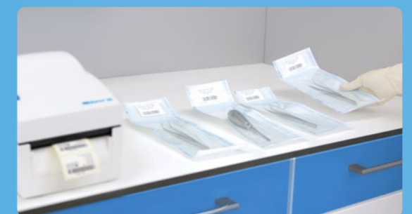
✓ Étiquetage avec MELAprint 80